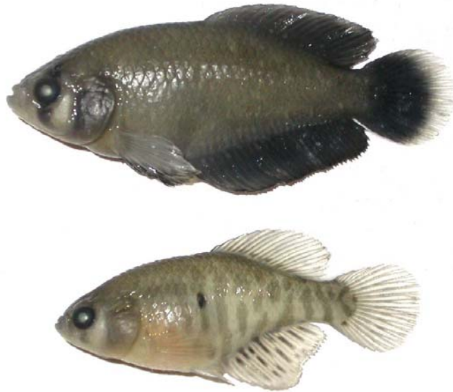
Fig. 7. Austrolebias bellottii , macho 49 mm LE, y hembra 38 mm LE, MACN 8506. Provenientes del mismo biotopo de A. robustus