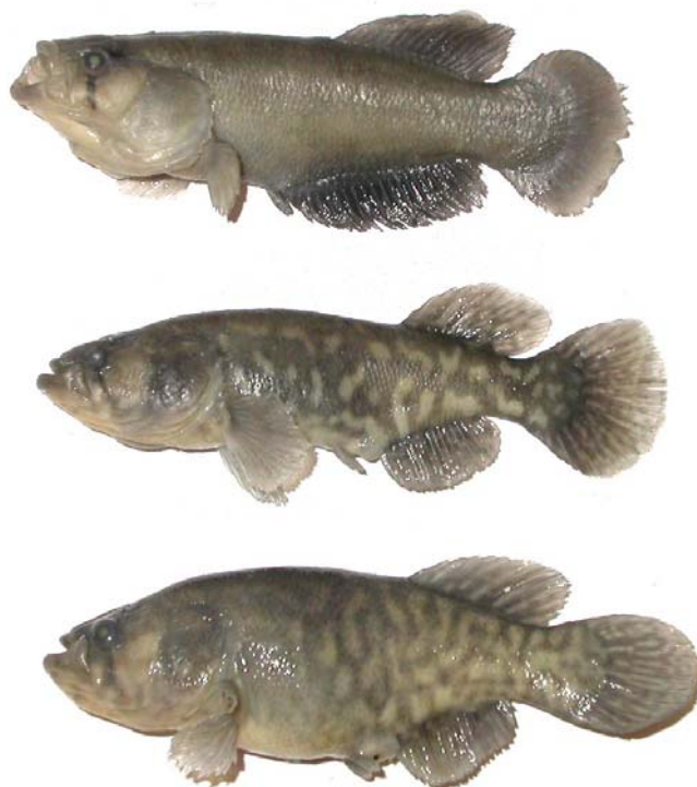
Fig. 6. M. elongatus , macho 109 mm LE, hembras 115 y 112 mm LE, MACN 8505., provenientes del mismo biotopo de A. robustus . Obsérvese el cuerpo más alto de una hembra debido a un vientre lleno de huevos, con respecto a la otra que ha desovado.

Austrolebias robustus pertenece a un grupo al que podríamos denominarlo como “grandes austrolebias” o grupo especie robustus , representado por A. noniuliensis , A. cinereus , A. vazferreirai y A. nioni ., las dos primeras mas similares a A. robustus por el tipo de escamación, por la presencia de excrecencias en los radios de la aleta anal y de las escamas y por el patrón de diseño y coloración. Un grupo cercano pero diferente estaría formado por A. bellottii , A. melanoorus , A. viarius , y A. vandenbergi .