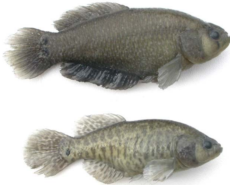
Fig. 4. Austrolebias robustus , macho 75.0 mm LE y hembra 64.0 mm LE, topotipos, MACN 8507.