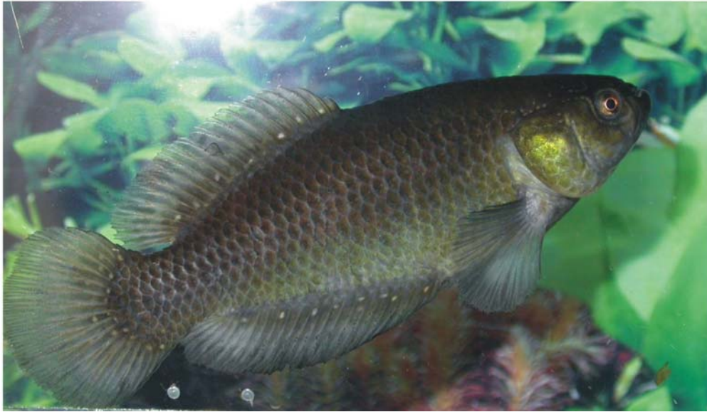
Fig 1. Austrolebias robustus (Günther), macho, topotipo, 76.0 mm LE, MACN 8507.