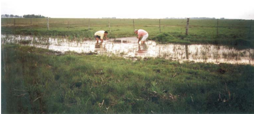
Fig. 3. Tierra típica de A. robustus , biotopo a 10 millas del Cabo San Antonio.