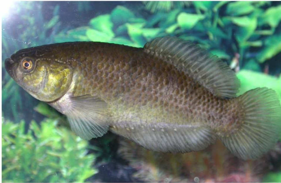
Fig. 8. Austrolebias robustus , macho, topotipo, 76.0mm LE, MACN 8507.