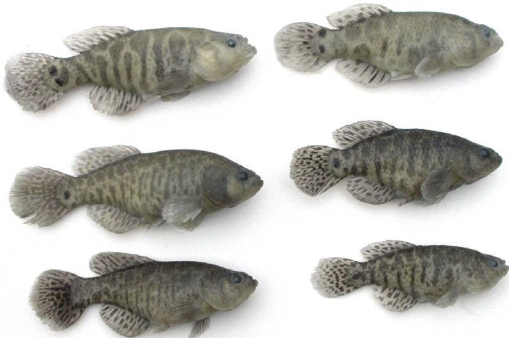
Fig. 5. Austrolebias robustus , 6 ej. hembras, topotipos, 49.0 - 64.0 mm LE, MACN 8507. Obsérvese la variabilidad de la misma población