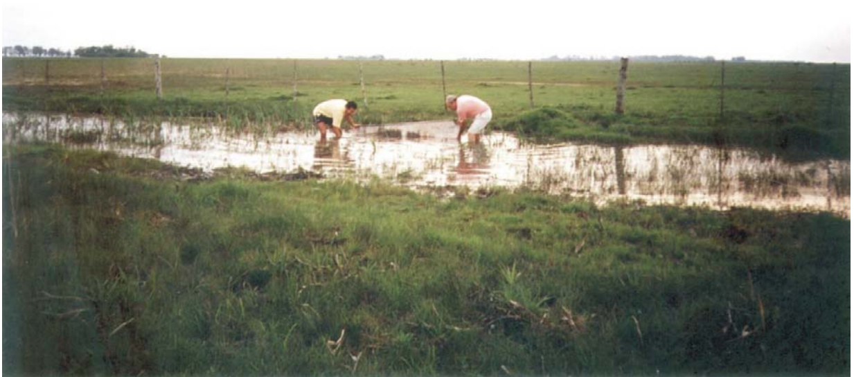
Tierra típica de A. robustus (Günther, 1883)